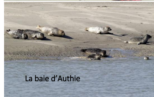
La baie d'Authie