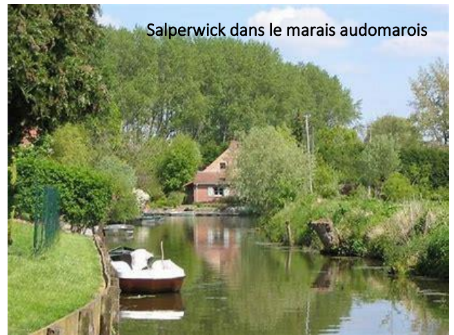
Salperwick dans le marais audomarois