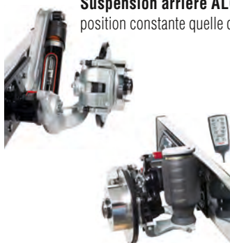
Suspensions pneumatiques AL-KO confort et sécurité de 1 re classe